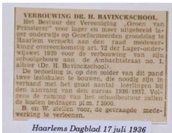
Haarlems Dagblad 17 juli 1936

Het plan werd met verdeelde reacties ontvangen. Alle lokalen waren aan de speelplaatszijde getekend. Hierdoor zou overlast kunnen ontstaan en was er volgens het bestuur "nooit gelegenheid voor openluchtspel". Toch ging het plan door want alleen op basis van de plannen van Verhagen was de gemeente Haarlem bereid de bouw te financieren. Al tijdens de bouw werden er forse wijzigingen in het ontwerp doorgevoerd. Het dak werd zo aangepast dat er later ook een bovenverdieping met lokalen zou kunnen worden ingericht. Dit was vooral bedoeld om een ruimte voor handenarbeid te kunnen maken. Het bleek een vooruitziende blik want amper 10 jaar later was de hele bovenverdieping in gebruik en zat de school zowel boven als beneden bomvol met leerlingen. In 1941 had de school 407 leerlingen die verdeeld waren over de klassen 1 t/m 6. Uitbreiding was dringend gewenst. Er kwam een nieuw schoolgebouw, grenzend aan de speelplaats met zeven lokalen. Ook dit gebouw had een zolder etage die als bovenverdieping gebruikt kon worden. Op 1 september werd het gebouw geopend. Naast de ingang is een gevelsteen geplaatst, die aan dit feit herinnerd. De Bavinckschool is nog altijd in het gebouw gevestigd. Recent werd de school nog uitgebreid met een aantal extra lokalen.