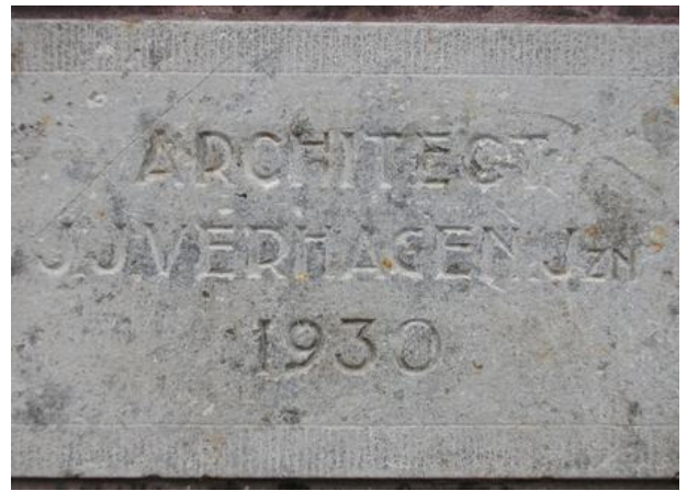
de gevelsteen, die werd ingemetseld.

Het plan werd met verdeelde reacties ontvangen. Alle lokalen waren aan de speelplaatszijde getekend. Hierdoor zou overlast kunnen ontstaan en was er volgens het bestuur "nooit gelegenheid voor openluchtspel". Toch ging het plan door want alleen op basis van de plannen van Verhagen was de gemeente Haarlem bereid de bouw te financieren. Al tijdens de bouw werden er forse wijzigingen in het ontwerp doorgevoerd. Het dak werd zo aangepast dat er later ook een bovenverdieping met lokalen zou kunnen worden ingericht. Dit was vooral bedoeld om een ruimte voor handenarbeid te kunnen maken. Het bleek een vooruitziende blik want amper 10 jaar later was de hele bovenverdieping in gebruik en zat de school zowel boven als beneden bomvol met leerlingen. In 1941 had de school 407 leerlingen die verdeeld waren over de klassen 1 t/m 6. Uitbreiding was dringend gewenst. Er kwam een nieuw schoolgebouw, grenzend aan de speelplaats met zeven lokalen. Ook dit gebouw had een zolder etage die als bovenverdieping gebruikt kon worden. Op 1 september werd het gebouw geopend. Naast de ingang is een gevelsteen geplaatst, die aan dit feit herinnerd. De Bavinckschool is nog altijd in het gebouw gevestigd. Recent werd de school nog uitgebreid met een aantal extra lokalen.