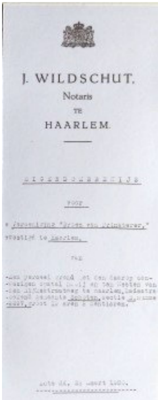
Koopakte van de grond t.b.v. de bouw Van de school