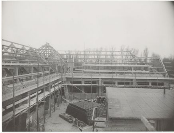
Foto van de bouw in 1930