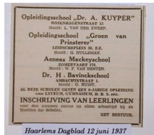
Haarlems Dagblad 12 juni 1937