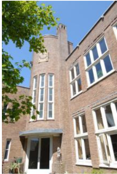
Aankoopakte uit 1929 van de grond t.b.v. de bouw van de school