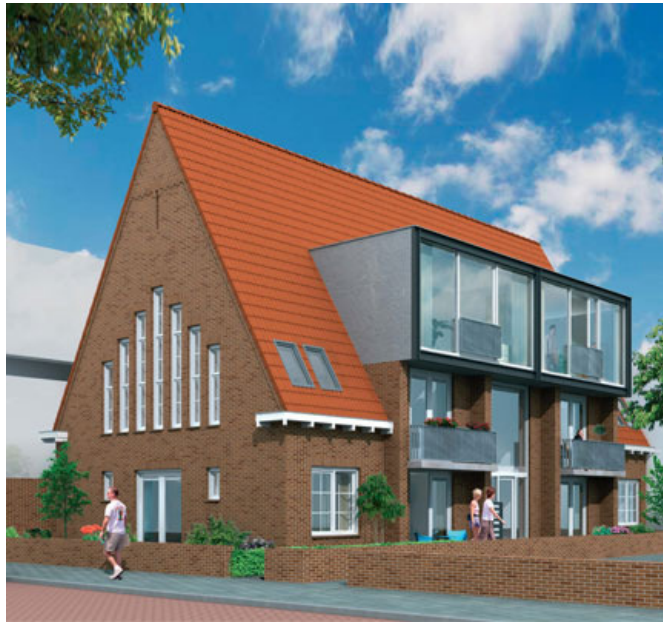
De oude gymzaal, voor en na de verbouwing tot appartementencomplex.