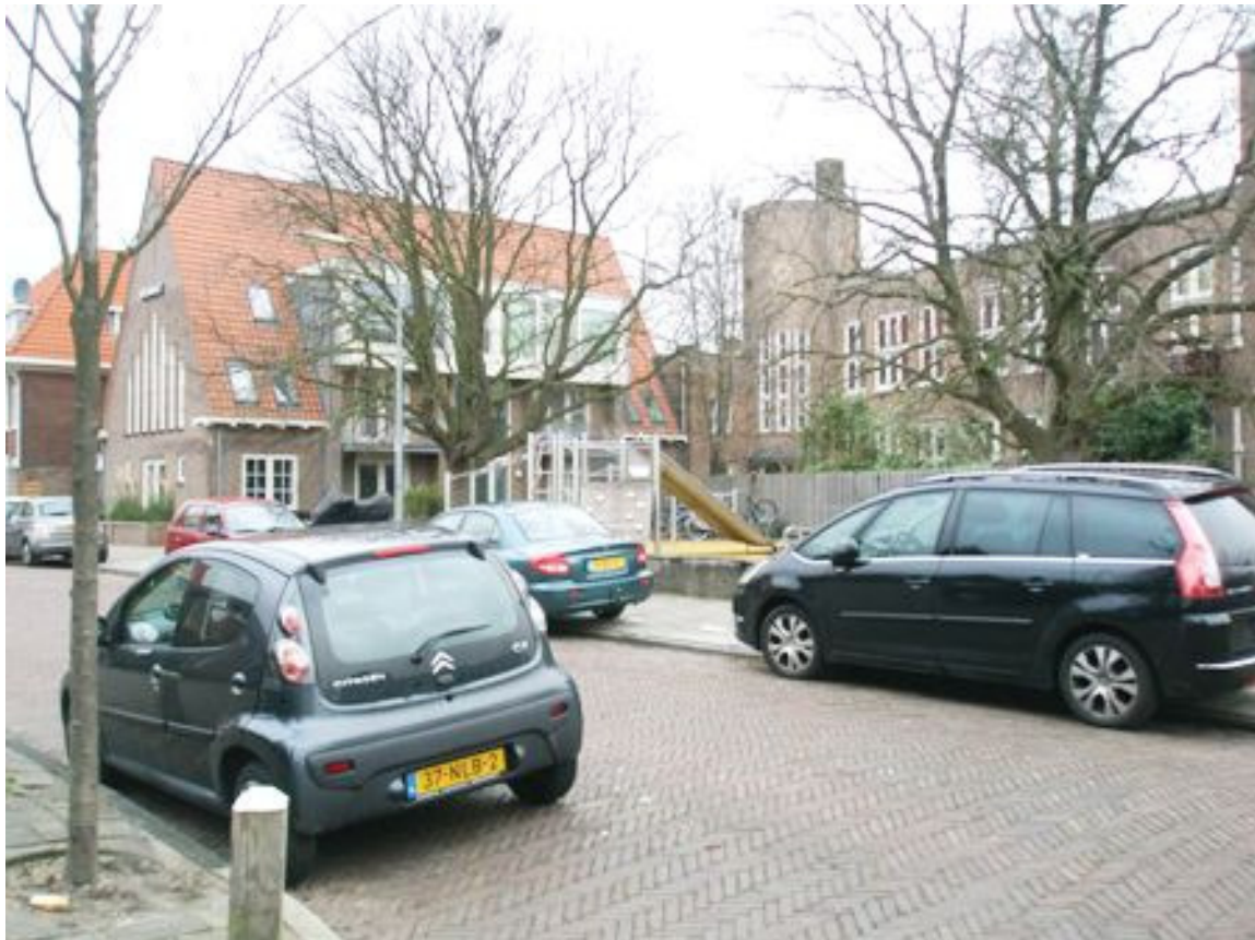
De opgeknapte gymzaal met de het schoolgebouw op de achtergrond.