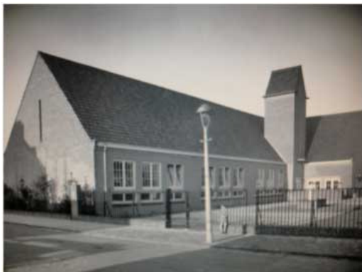
De Zonnehoek, Berkenstraat 1930

De school werd in 1951 verbouwd. De klassen op de begane grond werden uitgebreid met serres. In elk lokaal kwam een aanrecht en de ouderwetse banken werden vervangen door tafels en stoelen. Ook kleuterschool de Zonnehoek, die een aantal straten verderop was gelegen, werd een school volgens de Montessori lesmethode. Daar werden de kinderen voorbereid op het onderwijs op de Linaeusschool.