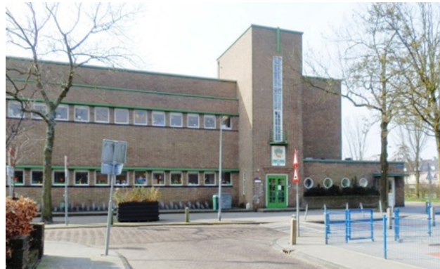
De Wilgenhoek anno 2011