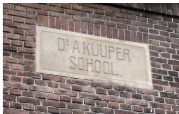
In de muur van de school zijn gevelstenen geplaatst ter herdenking aan de opening.