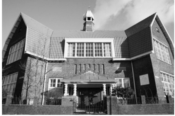
gevel van de markante entree

Aan de Noordoostelijk kant van de Haarlemse bolwerken werd in de jaren 1921-1925 een bijzondere buurt gebouwd door de gereformeerde woningbouwvereniging Patrimonium. Alle woningen in de buurt werden als één geheel ontworpen volgens de Engelse tuinstad gedachte. Deze stroming in de bouwarchitectuur ging uit van de bouw van woningen in Engelse Cottage bouwstijl, die aan de rand van bestaande steden werden ontwikkeld, om zo een overgang te maken tussen het platteland en de stad. Ook moesten deze tuinstadwijken zorgen voor een beter verbond met de natuur en een beter sociaal contact tussen de bewoners. De wijk werd gebouwd op de gronden van de vroegere boom- en bloemkwekerij “Rozenhage” van de familie Zoicher.