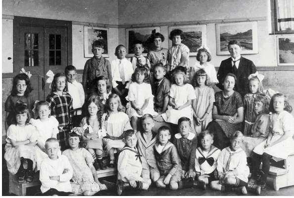
Een klas uit 1921