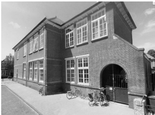
Het gebouw aan de Moolenaerstraat