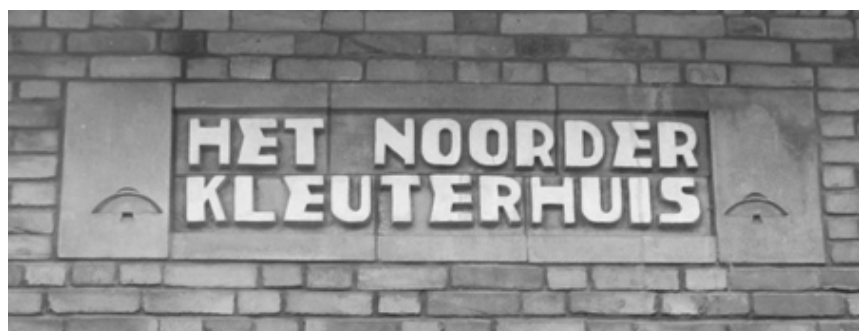
De naam van de school boven de ingang