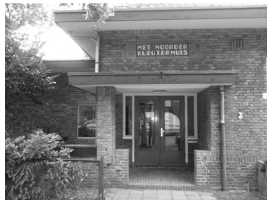
De ingang van het Noorder Kleuterhuis