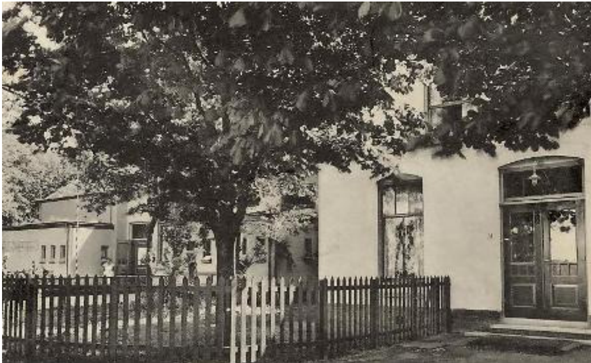
Ansichtkaart, vermoedelijk medio jaren dertig.

Op deze luchtfoto uit 1937 is te zien, dat de in aanleg zijnde Mr. Jan Gerritslaan rechtstreeks naar het pand van de voormalige St. Bavoschool loopt. In feite loopt de eerste aanleg van deze laan over het terrein, dat de doeltuinen vormt. Ook is te zien, dat ten noorden van de Jan Gijzenvaart (links op de foto) een complex met volkstuinen ligt. Dit is het eerste complex van de volkstuinvereniging Zonder Werken Niets (ZWN), die later richting Vergierdeweg is verplaatst. In 2011 vierden zij hun 80 jarig bestaan.