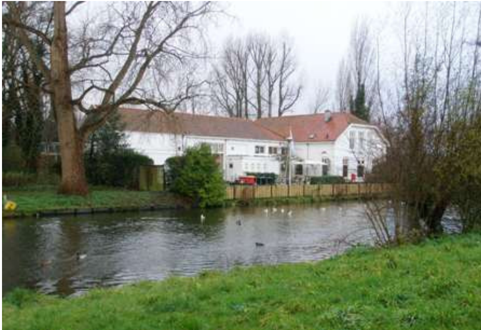
Voormalige Jeugdherberg, thans Stay Okay in 2011