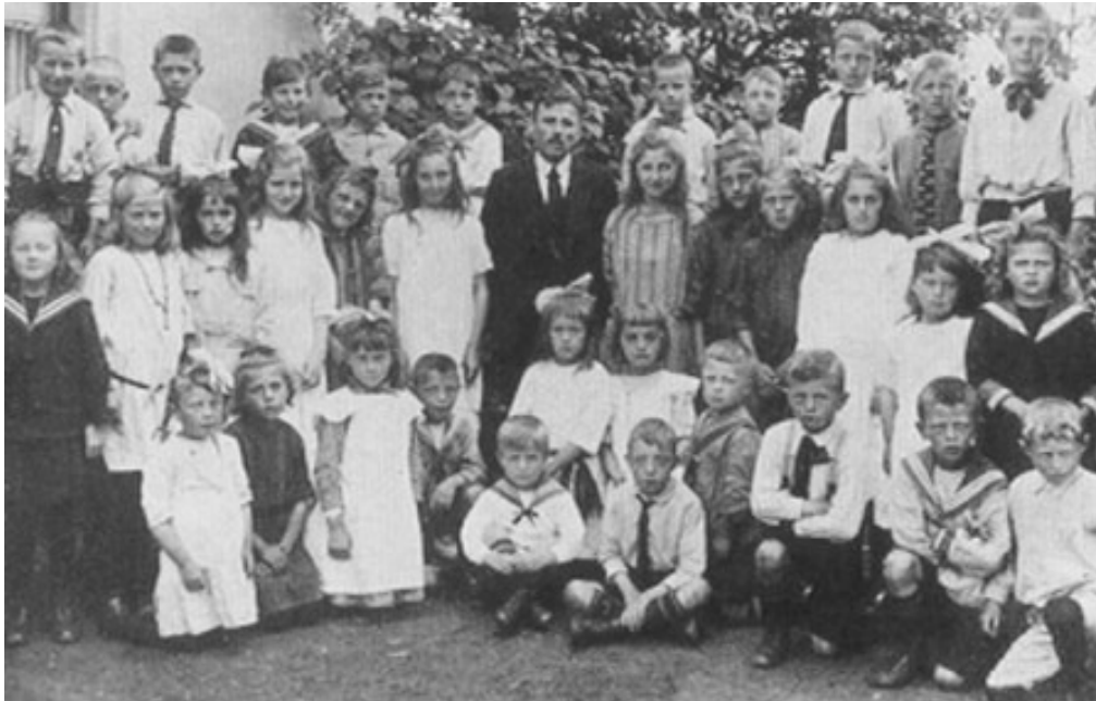
Een klas tijdens het schooljaar 1923 - 1924