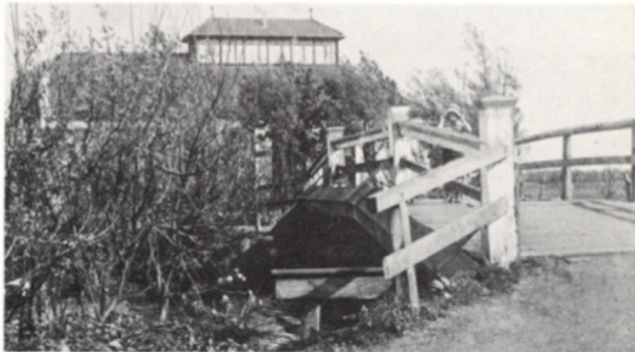
De Kerklaan langs de Jan Gijzenvaart zette zich via deze houten (in 1944 afgebroken) brug over de Delft voort tot Santpoort-Zuid. Op de achtergrond de St. Bavo school. (foto 1921)

Dat de nieuwe school nog niet van alle gemakken was voorzien, blijkt uit een besluit van 22 juli 1909, om bij de school een waterpomp te plaatsen.