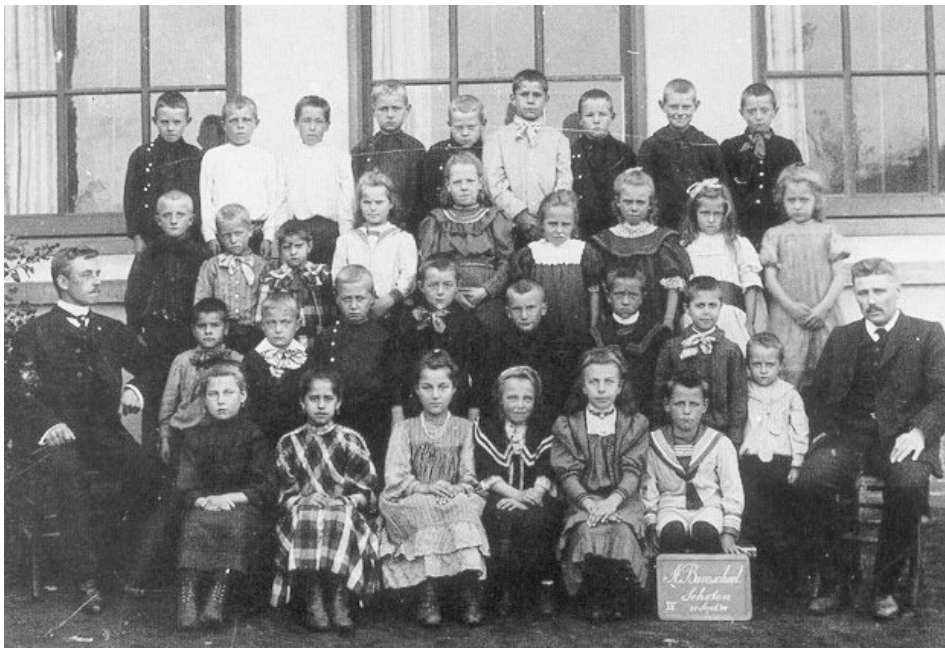
Een klas uit de beginjaren van de St. Bavo school. 1908