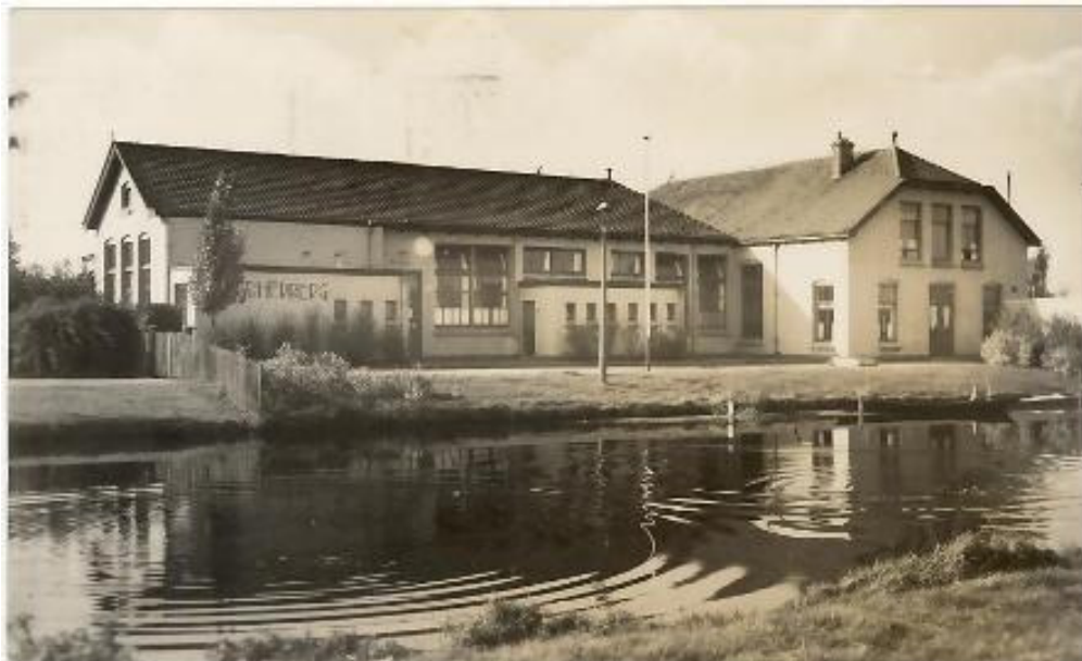
Ansichtkaart, datum onbekend.

Hieronder een uittreksel van een circulaire, zoals die onder de parochianen werd verspreid.