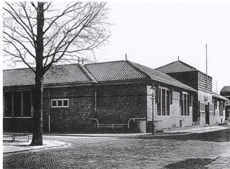
Willem de Zwijgerschool, Hertzogstraat 1

De schoolstrijd was voorbij, toen een wetswijzing in 1917 de volledige gelijkstelling van het lager onderwijs vastlegde, waardoor alle lagere scholen voor rijks- en gemeente bekostiging in aanmerking kwamen. Ook de beide Haarlemse verenigingen maakten hier dankbaar gebruik van en al snel werden zelfs twee scholen tegelijk opgericht.