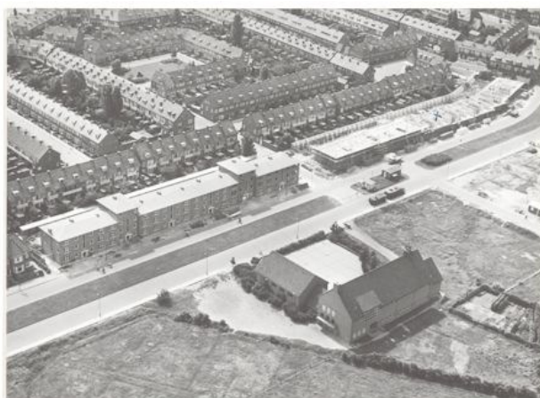
Luchtfoto vlak na de voltooiing

Door de tijdsomstandigheden was het niet mogelijk om behoorlijk standaardmeubilair aan te schaffen, zooals dat anders gebruikelijk was. Er is nu getracht van den nood een deugd te maken door eenvoudig meubilair te ontwerpen en voor deze school te doen vervaardigen. Er waren voor anders scholen ook nog wat stoelen noodig, zoodat een grooter aantal tegelijk besteld kon worden. Uit den aard der zaak moest hierdoor een iets grooter bedrag worden besteed, dan in normale tijden voor dit doel uitgegeven wordt; hetgeen er voor gekregen werd, is echter ook wat beter.