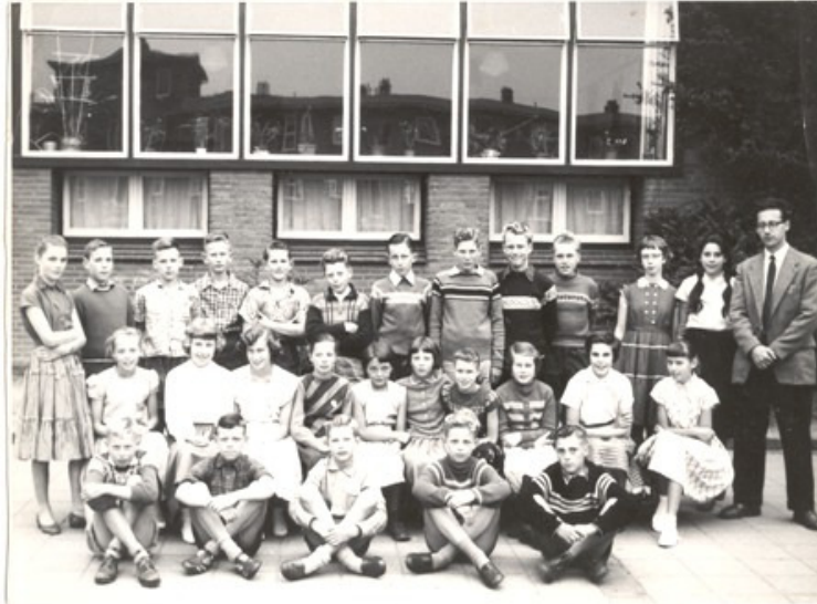
Klassiefoto uit een onbekend jaar. Let op de voor de school typerende raampartij.

Het ware te wenschen, dat onze nieuwe scholen ook een zekere royaliteit in ruimtelijk opzicht konden toonen en het bouwbesluit wat minder knellende banden aanlegde. Bij de stijgende kwaliteit, die we in onzen scholenbouw in het algemeen kunnen constateeren, zou dit een welkome aanvulling zijn, terwijl wat meer geld, om wat meer doorgewerkt te kunnen detailleren, geen overdaad zou zijn.