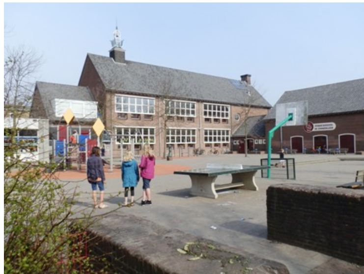
De school in 2011

Ik weet dat deze scholen ten tijde van haar ingebruikstelling opzien baarden en bezoek van elders lokten; ze zullen dus niet als norm kunnen gelden voor hetgeen in die jaren gebruikelijk was. Er is na deze periode een tijd gekomen, waarin scholen gebouwd moesten worden, doch weggestopt werden op binnenterreinen. Dat heeft uit het oogpunt van het onderwijs het voordeel van de rustige ligging, maar er werd toen ook niets meer aan het geestelijk deel van deze gebouwen gedaan en het werden kubieke meters ombouwde ruimten, die licht en lucht binnen lieten en waarin gewerkt kon worden – meer niet!