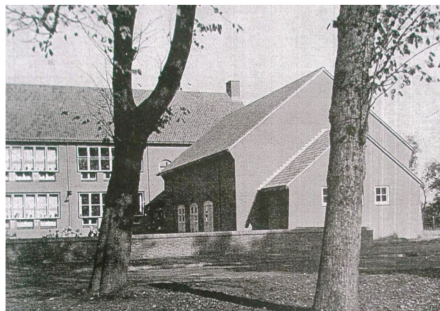
gezicht vanaf de Planetenlaan.