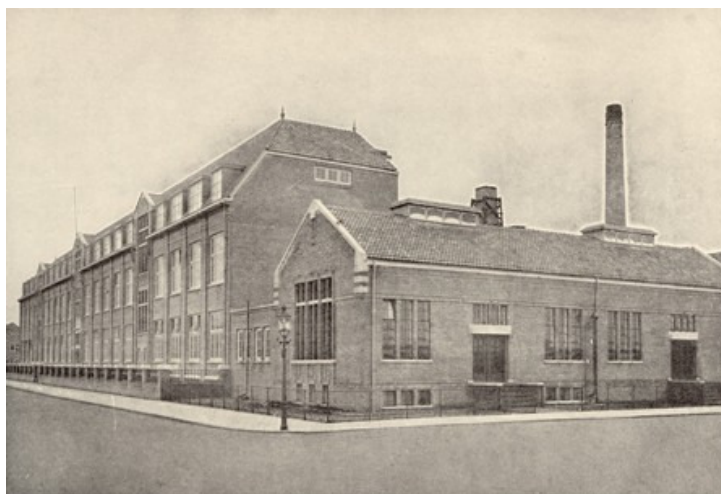
MTS gezien van de zuidzijde