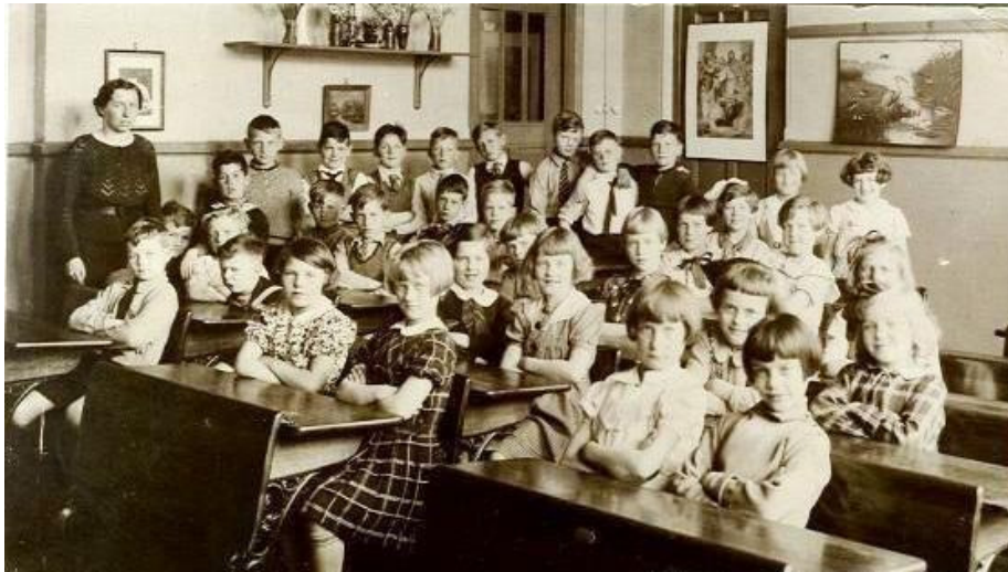
Luciaschool Klassefoto 1935-1937