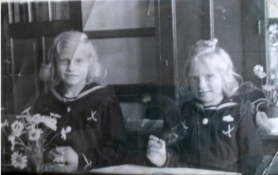
De foto van de zusjes.