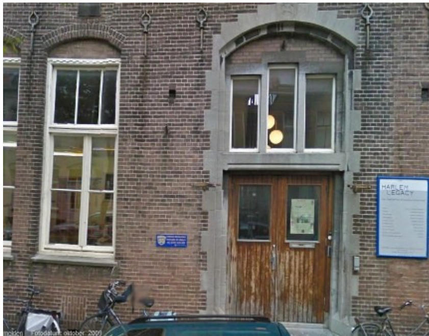
De oude ingang aan de Gen de la Reijstraat in 2011.

Opmerking: bij de opening van de tentoonstelling over scholen in voormalig Schoten is de naam van de zuster die was overleden, door een bezoeker in twijfel getrokken. Volgens haar zou het een andere zuster zijn geweest, die toen lag opgebaard.