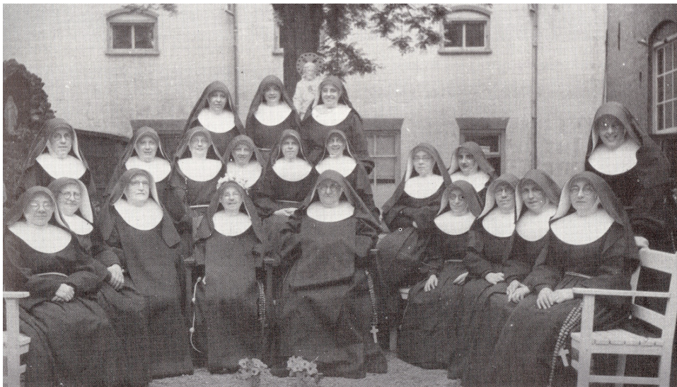
De zusters van het Lucia Klooster. 1945.

Wij waren daar ook vaak bruidje, omdat het een of ander feest was en dan moesten we van thuis bloemen meenemen. Ja, daar werd natuurlijk geen cent aan gespendeerd. We hadden pioenrozen in de tuin, die werden in een krantje gerold en die mochten dan mee naar school. Mijn zus die deed dat allemaal trouw en die zei niets, maar ik liep te muiten. Ik wilde echte bloemen. Het waren natuurlijk wel echte bloemen. Prachtig zelfs, maar ik vond het niks. Tweedehands bloemen vond ik het. En dan mocht je hopen, dat ze niet in die bus uit elkaar gerammeld waren.