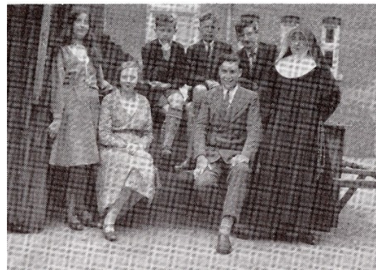
Linksboven: Schoolfoto uit 1922. Rechtsboven Zr. Conzagua met een mulo examenklas.