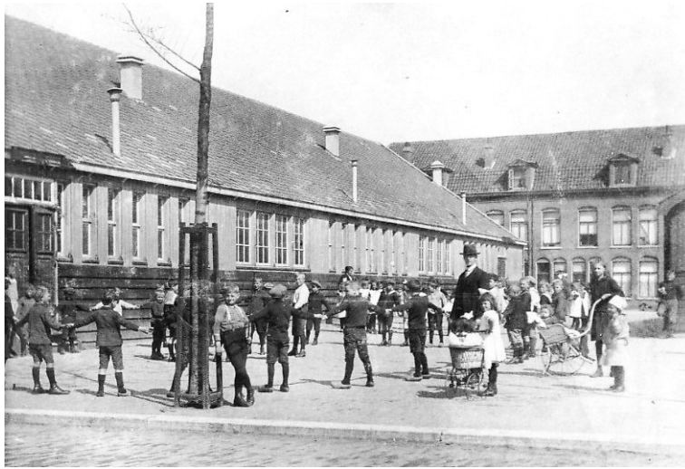
Pretoriaplein met houten noodschool ziende naar het noorden. 1921.

Wij waren daar ook vaak bruidje, omdat het een of ander feest was en dan moesten we van thuis bloemen meenemen. Ja, daar werd natuurlijk geen cent aan gespendeerd. We hadden pioenrozen in de tuin, die werden in een krantje gerold en die mochten dan mee naar school. Mijn zus die deed dat allemaal trouw en die zei niets, maar ik liep te muiten. Ik wilde echte bloemen. Het waren natuurlijk wel echte bloemen. Prachtig zelfs, maar ik vond het niks. Tweedehands bloemen vond ik het. En dan mocht je hopen, dat ze niet in die bus uit elkaar gerammeld waren.