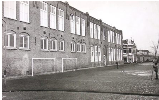
Het Pretoriaplein. Links een houten noodschool met spelende kinderen. Rechts de Luciaschool met ingang voor de minder goed bedeelden "de arme kant" genaamd.

Het Pretoriaplein, was een speeldomein voor kinderen. Dat plein werd "het Prikkie" genoemd. 's Winters als er sneeuw lag, werden daar lange glijbanen gemaakt, waarop vele kinderen achter elkaar hun schoenen af sleten. Aan het plein grensden het zusterklooster en de Luciaschool. Door de snel groeiende bevolking in het steeds rapper tempo volgebouwde voormalig Schoten, bleken de Overtonschool en de Lucia school, die beiden in forse gebouwen waren gehuisvest, ontoereikend, om alle leerlingen te kunnen huisvesten.