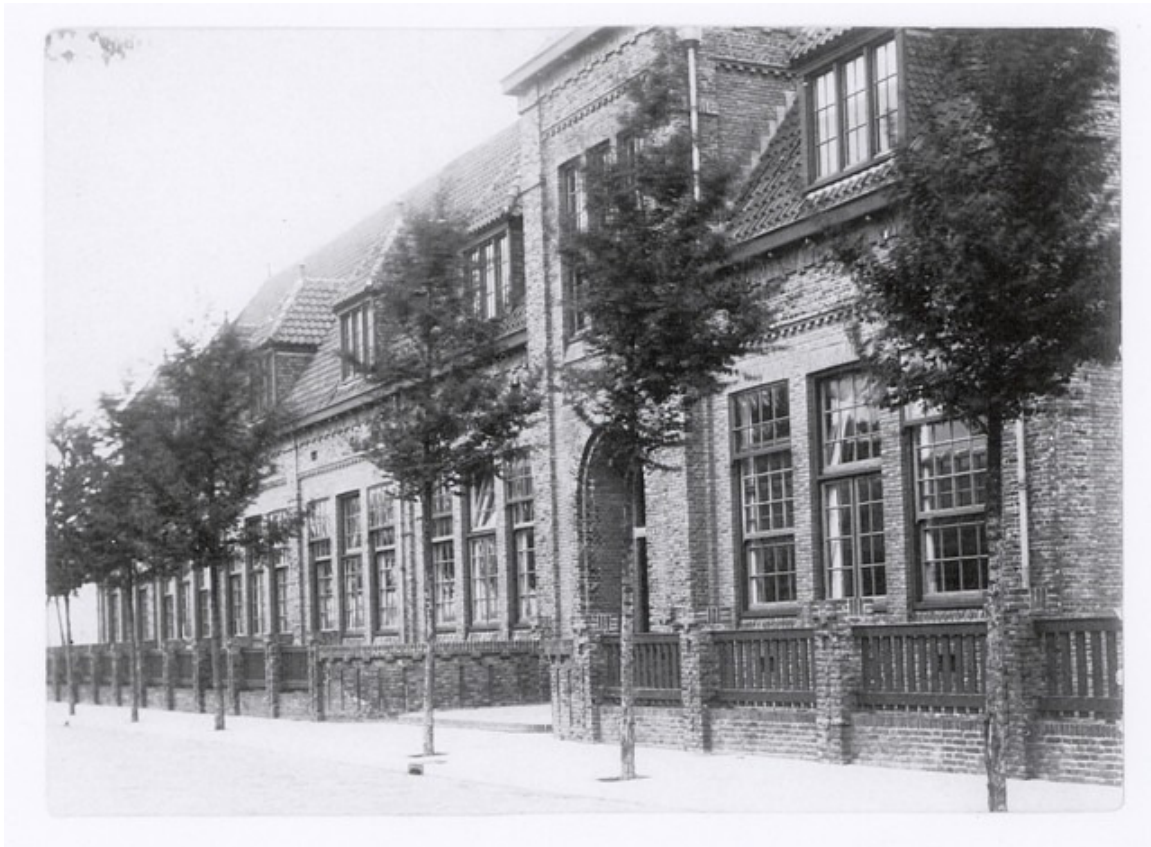
De Overtonstraat in 1928