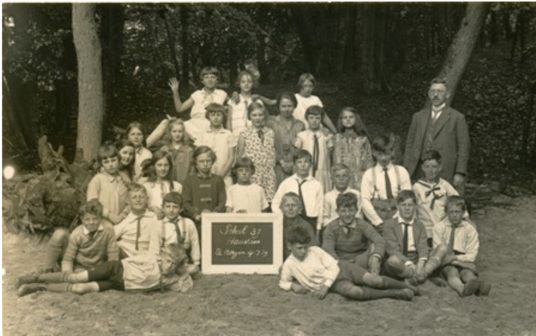
Schoolreisje naar Bergen, 1929

“We gingen ook al op schoolreisje. Met de bus naar Groenendaal of Zandvoort. De hogere klassen gingen drie dagen naar Ede, daar sliepen de kinderen in barakken.”