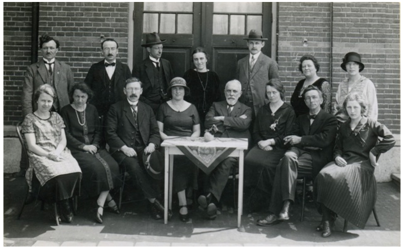
Het personeel op de kiek, 1925