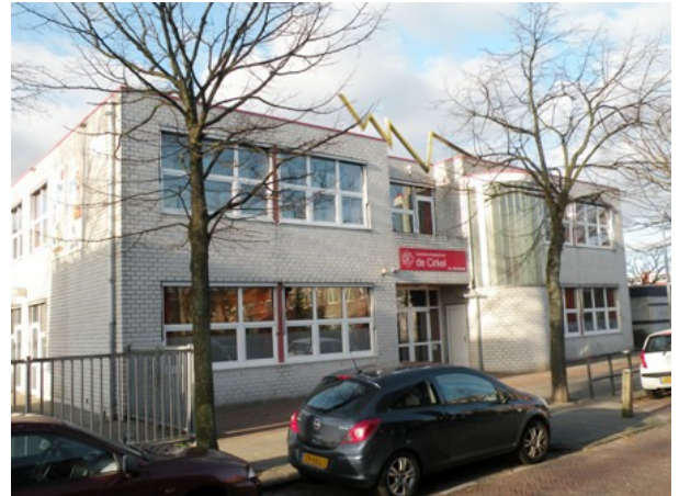
Is nieuwbouw altijd mooier? Basisschool De Cirkel, bouwjaar 1991