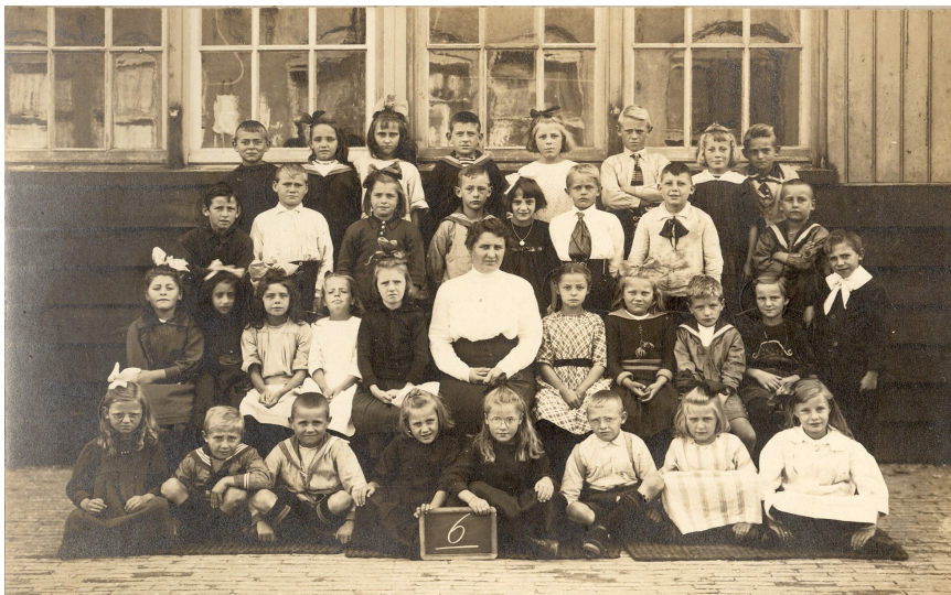
De klas poseert voor een houten noodgebouw aan het Pretoriaplein.

In 1914 barstte de school letterlijk uit haar voegen. Op het Pretoriaplein werden houten noodgebouwtjes, zogenoemde hulpscholen neergezet. Er waren 537 leerlingen, verdeeld over 18 klassen. Bij een grote school was – ook al in die tijd – het schoolhoofd ambuland. Hij had geen klas, maar hield zich bezig met toezicht en administratie. Enkele gemeenteraadsleden vonden dit 'onwenselijk en duur' . Maar B en W stelden dat op zo'n grote school leiding en controle nodig was en dat de bovenmeester bij ziekte van een van de onderwijzers kon invallen.