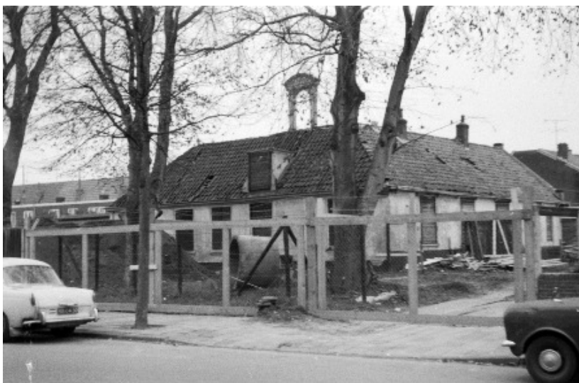
In de zestiger jaren werden hekken om het gebouw geplaatst en werd begonnen met renovatie.

In de zestiger jaren was het pand dichtgetimmerd en verkeerde het in vervallen staat. In de zeventiger jaren werd het gebouw geheel gerestaureerd. Er werd een nieuw deel aangebouwd en het pand werd toen in gebruik genomen als filiaal van de Stadsbibliotheek. Enkele jaren geleden is het gebouw in gebruik genomen door het Rode Kruis.