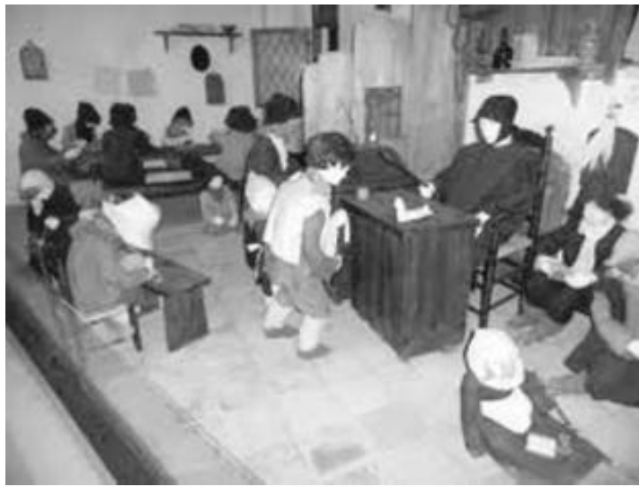
Voorbeeld van een schoolklas uit het Onderwijsmuseum.

Toch hadden de schoolmeesters van toen, behalve voorrechten en macht, ook hun plichten.