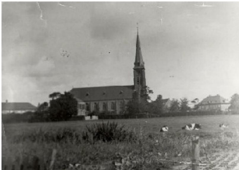
Gezicht op de kerk te Schoten, begin vorige eeuw. De kerk werd in 1857 gebouwd en kwam in de plaats van het oude (schuil)kerkje en werd in 1934 gesloopt.

Eind 19e eeuw was de gemeente Schoten een agrarisch gebied van ruim 600 hectare met een inwoneraantal van slechts 650 mensen. Weilanden met vee en boerderijen bepaalden het gezicht. Door de grondsamenstelling kon er geen sprake zijn van akkerbouw.