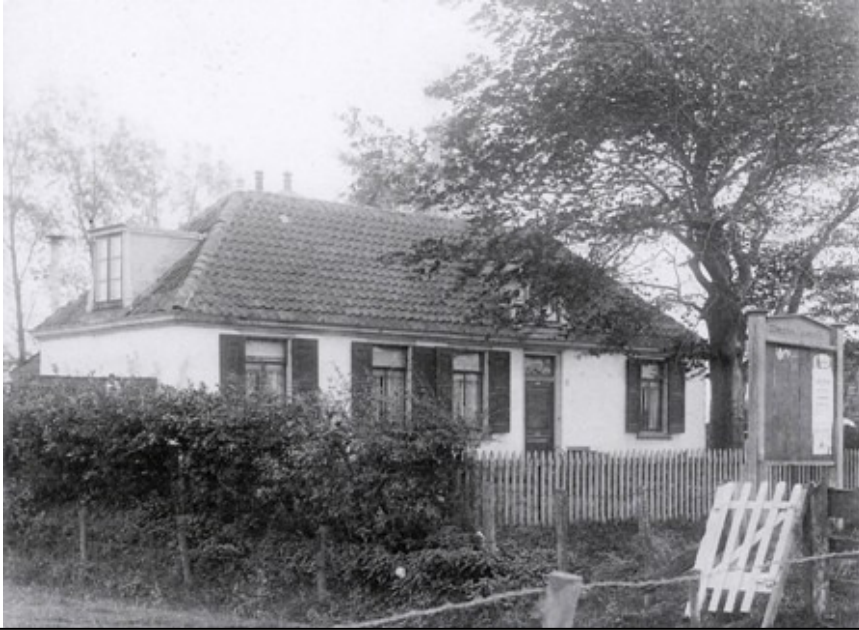
Het Rechthuis ca. 1920

Tenslotte het gebouw. In 1885 werd aan de Rijksstraatweg de Openbare Lagers School A geopend. In 1906 werd de St. Bavoschool aan de Jan Gijzenvaart in gebruik genomen. Toen het gemeentebestuur naar het nieuwe raadhuis aan de Rijksstraatweg verhuisde, verdwenen de laatste leerlingen uit het oude gebouw. Het pand aan de Vergierdeweg ging toen als woning dienen van de toenmalige veldwachter van Schoten. Later zouden diverse andere Schotenaren daar nog wonen. Het pand verpauperde zienderogen. Aan het eind van de vijftiger jaren kwam men met het plan het pand te slopen. In die tijd was Walgien er gevestigd met zijn handel in fietsen en bakfietsen.