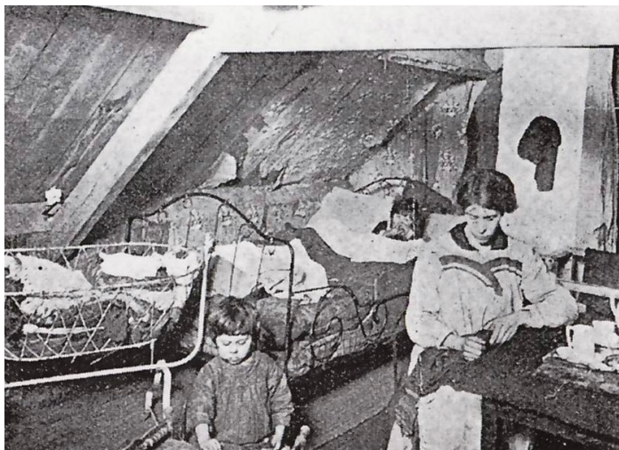
Het Rechthuis werd onder zeer slechte omstandigheden jarenlang door diverse gezinnen bewoond. (foto 1916)

In de zestiger jaren was het pand dichtgetimmerd en verkeerde het in vervallen staat. In de zeventiger jaren werd het gebouw geheel gerestaureerd. Er werd een nieuw deel aangebouwd en het pand werd toen in gebruik genomen als filiaal van de Stadsbibliotheek. Enkele jaren geleden is het gebouw in gebruik genomen door het Rode Kruis.