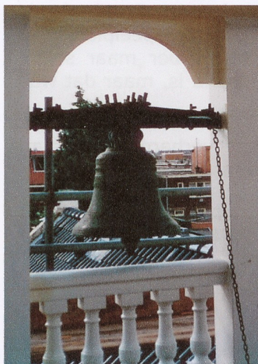
Klokkenstoel met klok