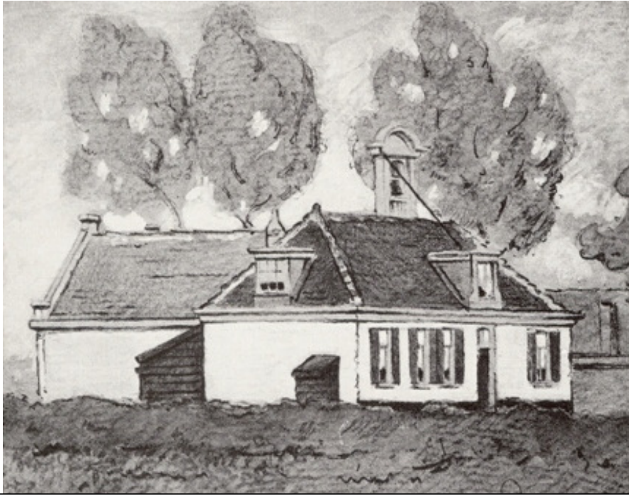
Tekening van G. Kerkhoff uit 1910