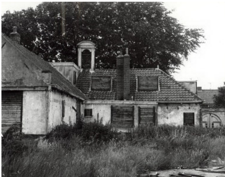
Achterzijde van het in vervallen staat verkerende pand in 1968

Tenslotte het gebouw. In 1885 werd aan de Rijksstraatweg de Openbare Lagers School A geopend. In 1906 werd de St. Bavoschool aan de Jan Gijzenvaart in gebruik genomen. Toen het gemeentebestuur naar het nieuwe raadhuis aan de Rijksstraatweg verhuisde, verdwenen de laatste leerlingen uit het oude gebouw. Het pand aan de Vergierdeweg ging toen als woning dienen van de toenmalige veldwachter van Schoten. Later zouden diverse andere Schotenaren daar nog wonen. Het pand verpauperde zienderogen. Aan het eind van de vijftiger jaren kwam men met het plan het pand te slopen. In die tijd was Walgien er gevestigd met zijn handel in fietsen en bakfietsen.